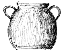
Marste à deux cuse