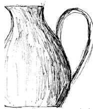
grand pichet gelbe'